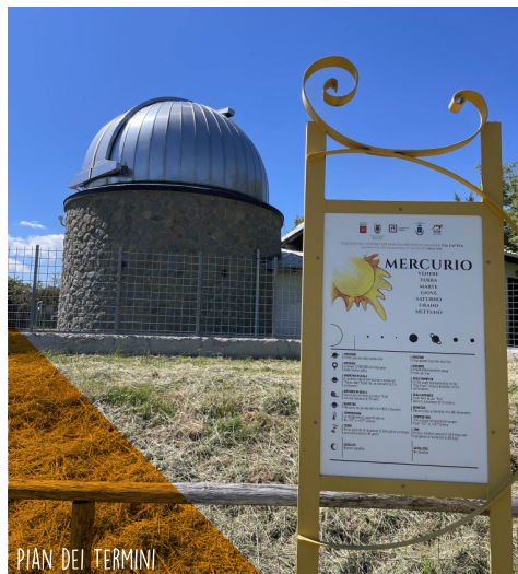
PIAN DEI TERMINI

Contatti: tel 800 974102 (Ecomuseo Montagna P.se)